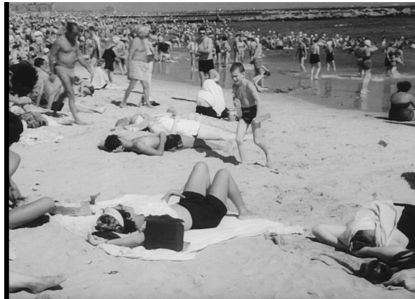
Le Petit Fugitif, Morris Engel, Ruth Orkin et Raymond Abrashkin (1953)