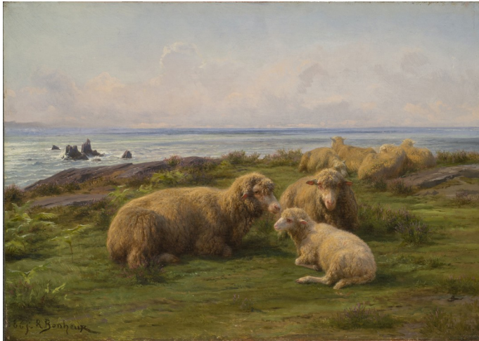
Moutons au bord de la mer, Rosa Bonheur (1865)