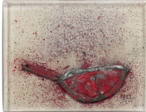
Nature morte, compression, César (1971)