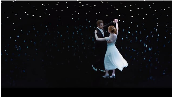
Lalaland , Damien Chazelle (2016)