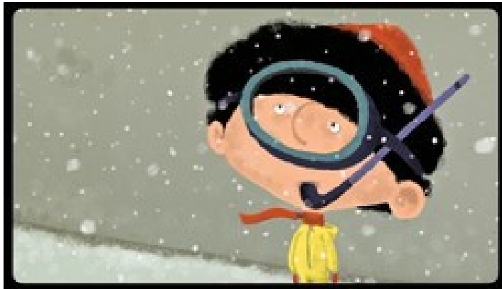
Le Petit Cousteau , Jakub Kouril (2014) Programme Maternelle au cinéma « Voyages de rêve »