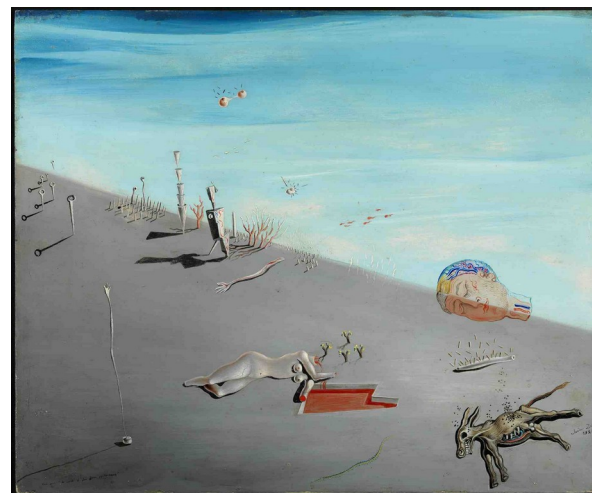
Étude pour Le miel est plus doux que le sang, Salvador Dalí (1926)