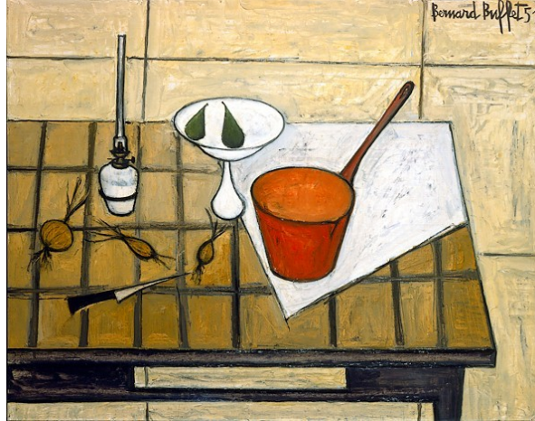
La casserole rouge, Bernard Buffet (1951)