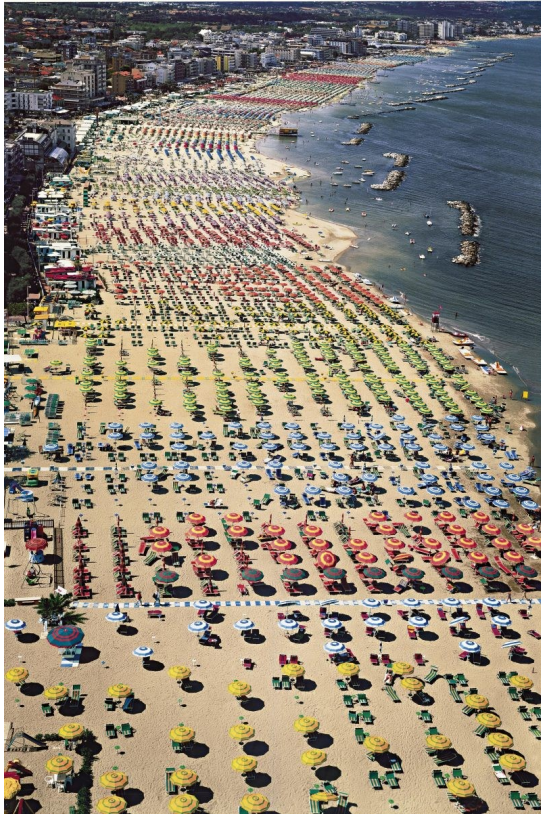
Rimini, Andreas Gursky (2003)