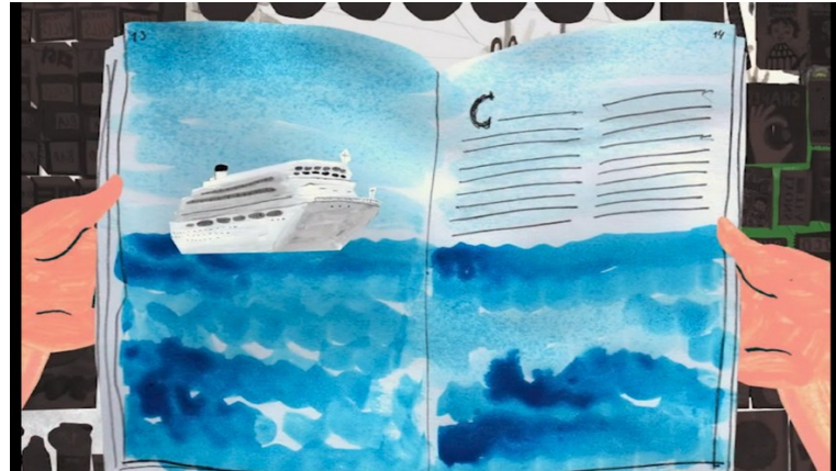
Le Kiosque , Anete Melece (2013) Programme Maternelle au cinéma « Voyages de rêve »