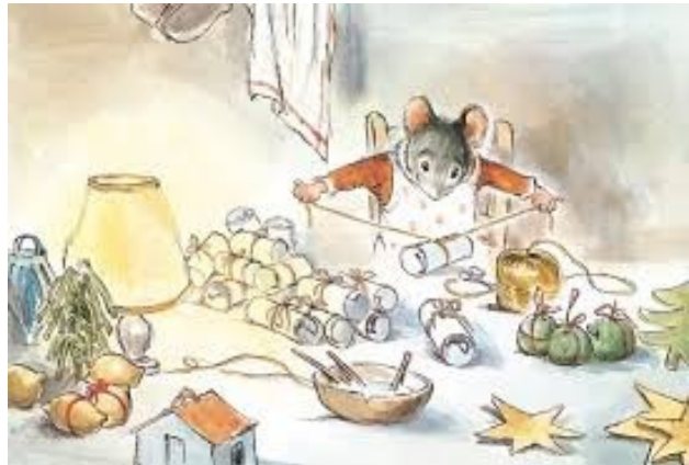
Le Noël de Ernest et Célestine, Gabrielle Vincent (1983)