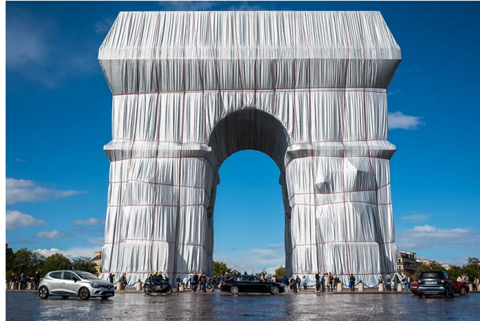
Empaquetage de l'Arc de Triomphe à Paris, Christo (2021)