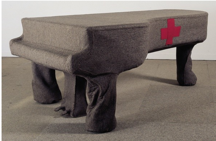
Infiltration homogène pour piano à queue, Josephe Beuys (1966)