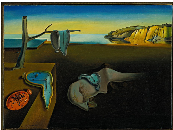
La persistance de la mémoire, Salvador Dalí (1931)