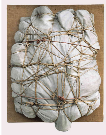
Empaquetage, Christo (1960)