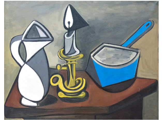
La casserole émaillée, Pablo Picasso (1950)