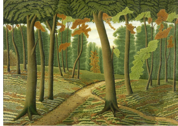
La forêt , Dominique Peyronnet (non daté)