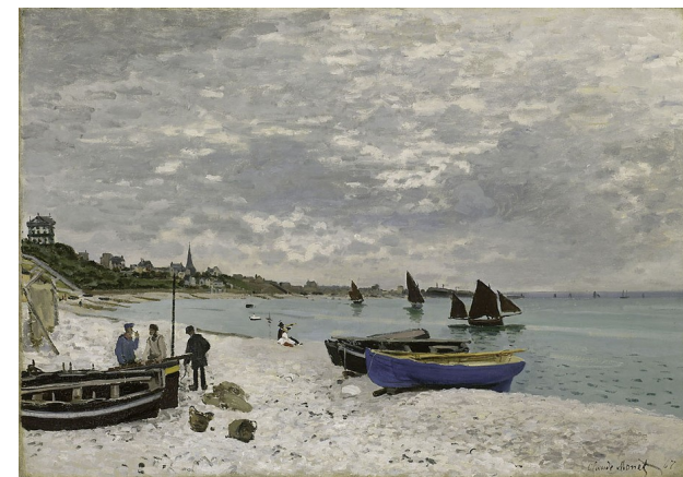
La plage de Saint-Adresse, Claude Monet (1867)