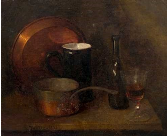
Nature morte de cuisine, Henri Fantin-Latour (1856)