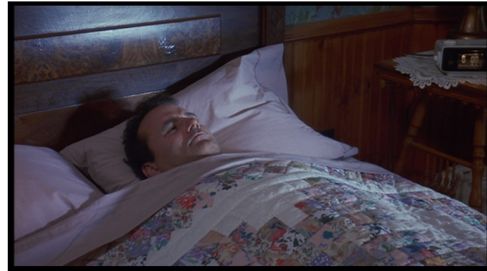
Un jour sans fin , Harold Ramis (1993)