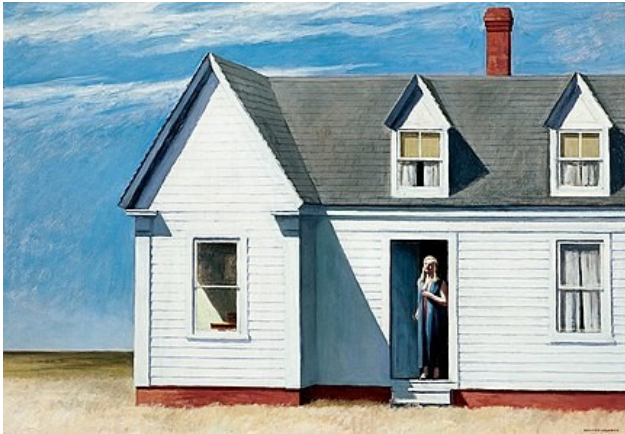
High Noon , Edward Hopper (1949)