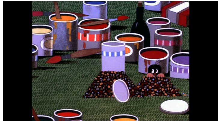
La petite taupe peintre , Zdenek Miler (1972) Programme Maternelle au cinéma « La petite taupe »