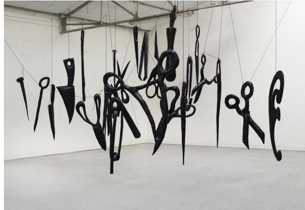
Les spectres des couturières , Installation de Annette Messager (2015)